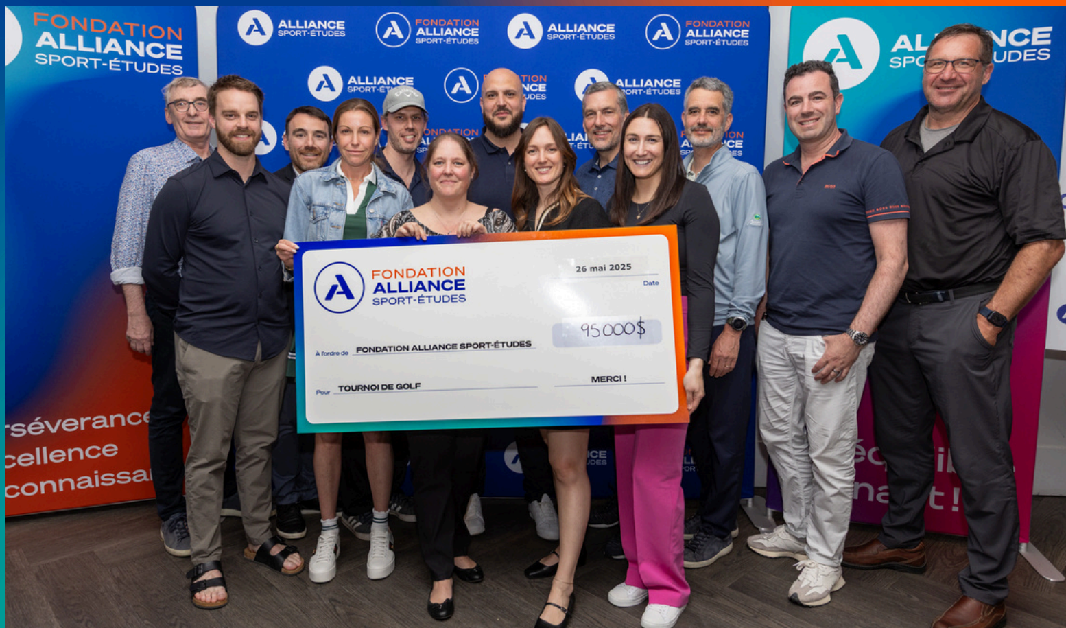
Des membres du comité golf et du CA de la Fondation Alliance Sport-Études

Plus de 200 golfeurs et golfeuses issus des milieux corporatif, scolaire et sportif se sont réunis hier, au prestigieux Club de golf Le Blainvillier pour la 38 e édition du tournoi de golf de la Fondation Alliance Sport-Études.